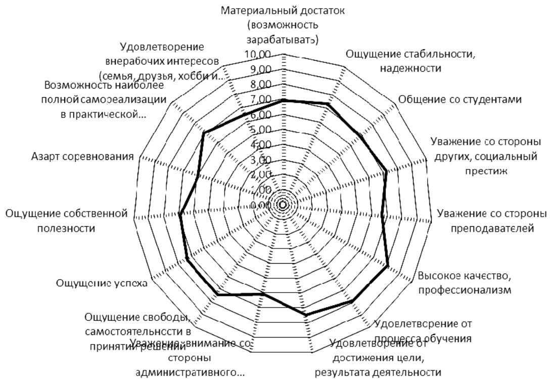
Рис. 2. Мотивационные ожидания студентов как клиентов вуза

Наиболее высокие показатели по мотивационным ожиданиям студентов от обучения в вузе получили такие показатели, как «высокое качество и профессионализм профессорско-преподавательского состава» (8,05 из 10), «удовлетворение от процесса обучения» (7,91), «ощущение свободы, самостоятельности в принятии решений, выбор дисциплин» (7,41), «ощущение успеха в процессе обучения» (7,36). Менее всего ожидают студенты от обучения в вузе реализации таких мотивов, как «азарт соревнований» и «уважение, внимание со стороны административного ресурса вуза» (5,93 и 6,1 соответственно).